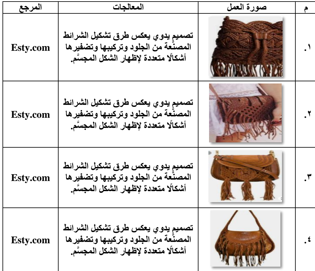
جدول مداخل المعالجات التشكيلية ثلاثية الأبعاد

ثانيًا: المعالجات التكنولوجية ذات الهيئات النحتية للأحذية: