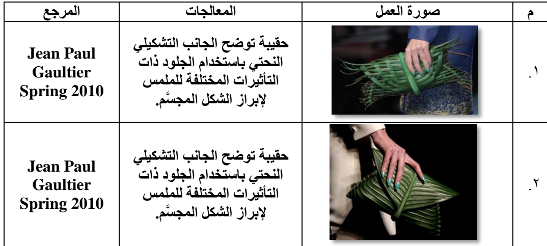
جدول مداخل المعالجات التشكيلية ثلاثية الأبعاد

وستعرض الباحثة جدولاً تطبيقياً للحقائب يوضح المداخل المتعددة للمعالجات التشكيلية ثلاثية الأبعاد من حيث الخامات والتقنيات الحديثة المستخدمة.