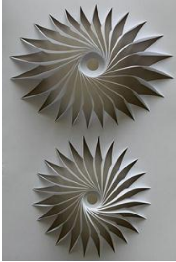
شكل رقم (٨) تقنيات التفريغ

كما هو موضح بالشكل رقم (٨) فعند رسم دائرة سوداء على ورقة بيضاء تحقق إحساس جديد بالدائرة السوداء تمثل شكلاً إيجابياً والمساحة البيضاء المحيطة بها تدرك على أنها تفريغ سلبي، فالشكل إيجابي وليس الفراغ إلا عكس الشكل.