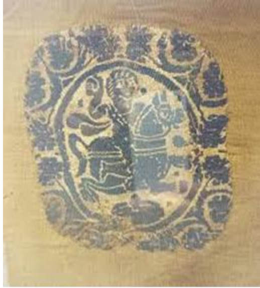
شكل رقم ( ٤ )

قطعة نسيج صوفى موضح فيها ملء الفراغ في الفن القبطي. العصر البيزنطي، القرن الرابع إلى الخامس الميلادي، موقع الاكتشاف: غير معروف مواد المادة: عضوية، ألياف (نباتية/حيوانية)، صوف، الطول: ١٨ سم؛ العرض: ١٨ سم.