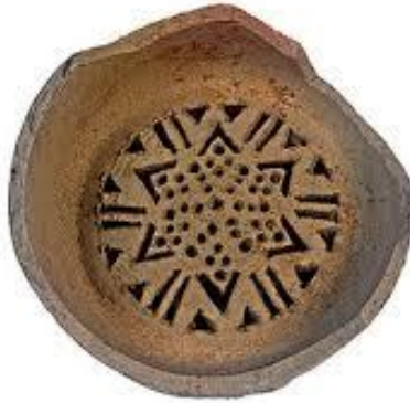
شكل رقم (٦) شباك قلة من الفخار

لقد برع الفنان المسلم في فن الزخرفة الإسلامية من خلال استخداماته للخطوط الهندسية والنباتية والعناصر الحية (الحيوانية - النباتية) وكيفية صياغتها في أشكال فنية إبداعية ومن روائع الفن الإسلامي التي انتشرت انتشاراً واسعاً " شبابيك القل " حيث جمعت بين جنباتها معظم تقنيات وزخارف العصور الإسلامي التي صنعت فيه. تعرف شبابيك القل هي قطع مستديرة تثبت عادة بين بدن القلة ورقبتها لتحول دون