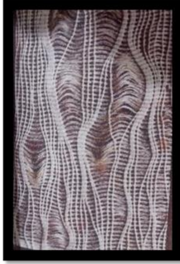
عمل فني رقم (١)

٣. فمن خلال ماسبق تقوم الباحثة بعرض وتحليل مجموعة من التطبيقات العلمية الذاتية وتتمثل في (٣) مشغولة متنوعة وتم تحليلها على عدة نقاط وهي :