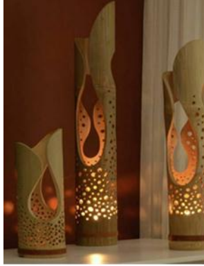
شكل رقم (١٣) تقنية التشييف

ارتكز البحث في التحليل النتائج على الاتى: