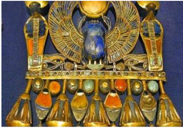
الشكل رقم ( ٣ ) قلادة فرعونية

ولقد تعامل الفنان المصرى القديم مع الخامات المتاحة له فى البيئة المحيطة من حوله فاستخدم الجلود بانواعها من خلال الحيوانات التى يصيدها حيث استخدمها فى "صناعة الأساور وأغطية الوسائد وأجوية الخناجر والجعباب التى تحفظ السهام والدروع وعدة الخيل وانواع من الحبال والنعال ومقاعد الكراسي والآسرة (سليمان حسن، ١٩٨٢)