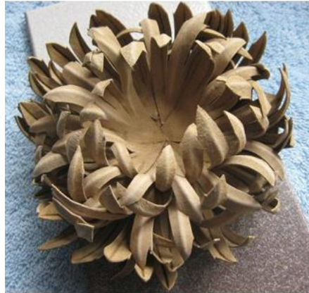
شكل رقم (٩) التراكب في التفريغ

هو التعبير الذي نطلقه حين تعمل إحدى الوحدات الداخلة في التكوين على إخفاء جزء من وحدة أخرى تقع خلفها، والمتراكب مزيا وعيوب فمن مزاياه انه يعمل على تحقيق وحدة التكوين ويعاب فهو يميز وحدة بصرية عن وحدة أخرى (عبد الفتاح رياض، ١٩٨٩، ص ١٥٢).