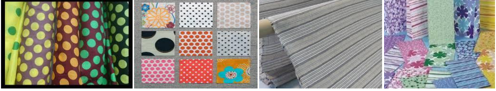
( الشكل 10 ) .

أقمشة ذات رسوم خطية و منقطة ( منتظمة - غير منتظمة ) كما في ( الشكل ١٠ ).