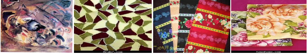
( شكل ١١ ) .

أقمشة ذات الرسوم النباتية و تجريدية حرة ( منتظمة - غير منتظمة ) كما في ( الشكل ١١ ).